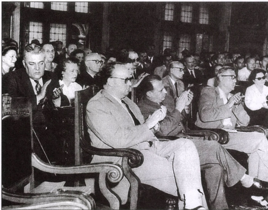
Az Írószövetség kongresszusa 1951 áprilisában

A szépirodalom iránti érdeklődés érzékelhetően visszaesett, az évtized közepére a szakkönyvek és a lektűrök kiadása messze megelőzte a szépirodalomét. Ekkor már elképzelhetetlen volt, hogy zsúfolásig megtöltse a közönség a